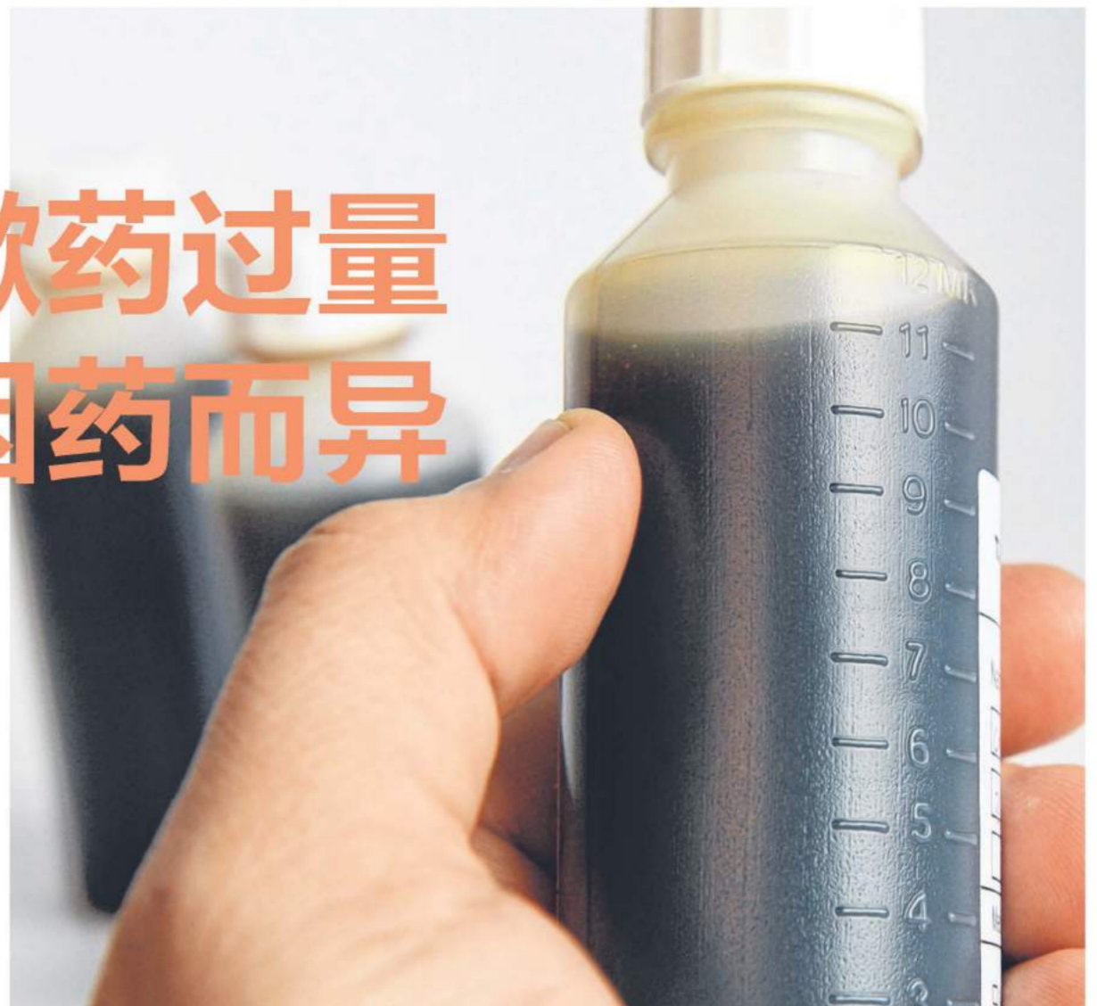
服用咳嗽和伤风药物可能给婴儿和儿童造成副作用，除非万不得已，否则应该避免服药，而且切忌自己配药给孩子。（档案照）